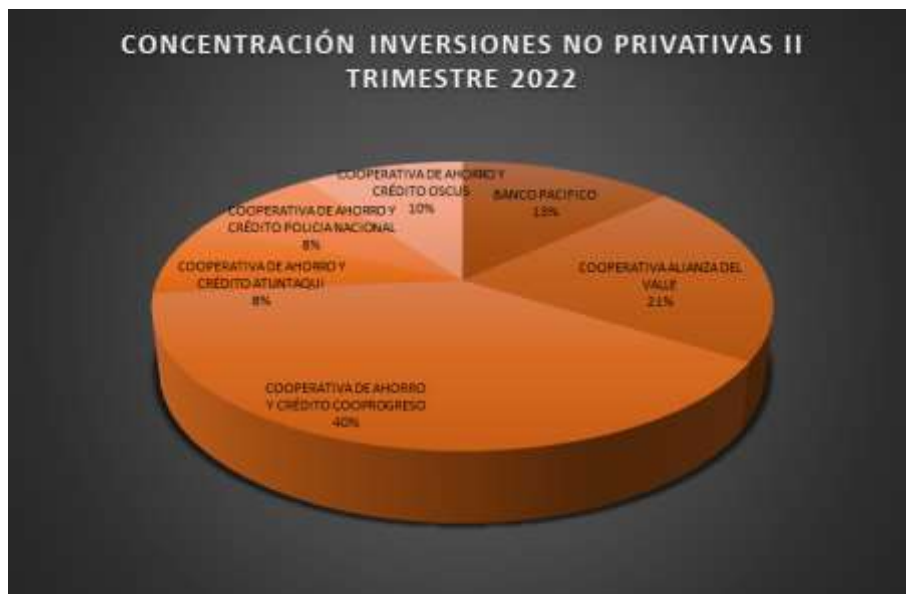
Cuadro Nro. 22

Elaborado por: Coordinación de Inversiones Privativas y No Privativas.