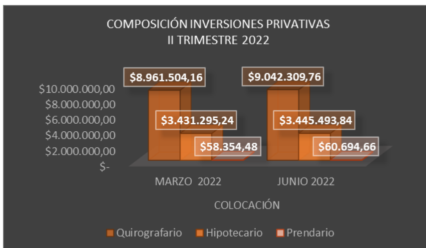
Cuadro Nro. 15