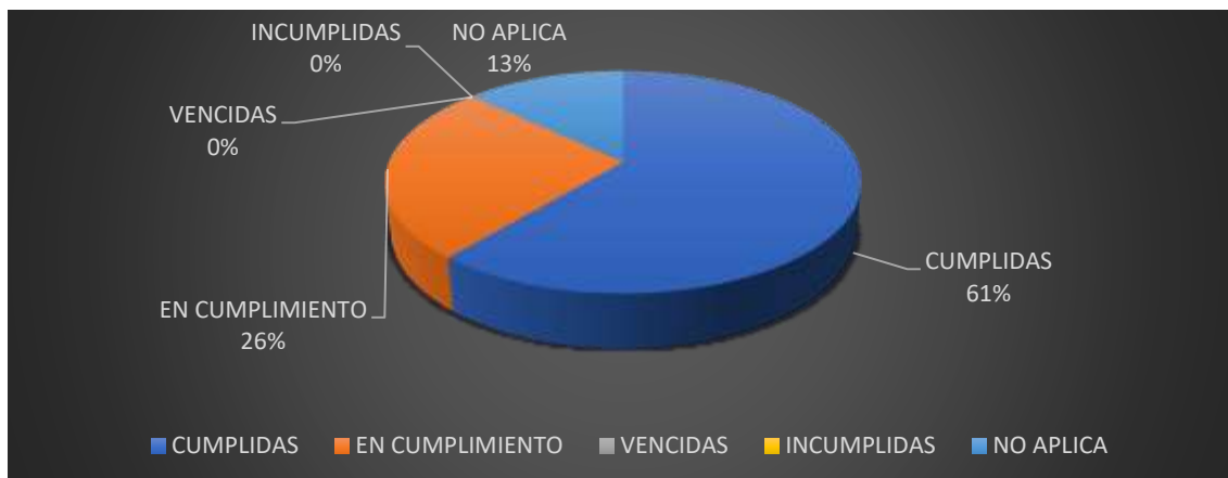
Cuadro Nro. 11