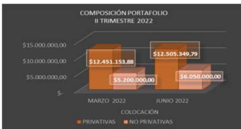
Cuadro Nro. 13

Elaborado por: Coordinación de Inversiones Privativas y No Privativas